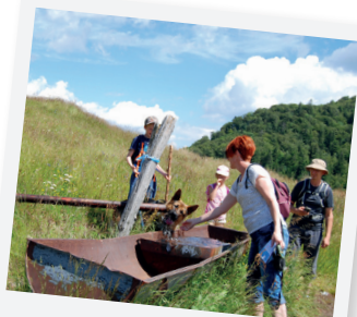
IL Y EN A POUR TOUT LE MONDE !