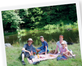
PIQUE-NIQUE EN FAMILLE !