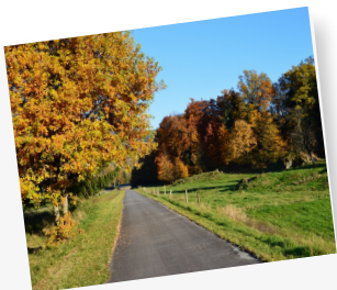
La Voie Verte des Hautes-Vosges