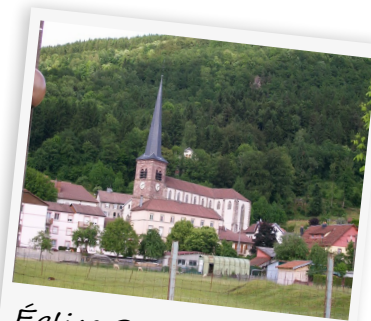
Église Saint-Etienne de Rupt-sur-Moselle