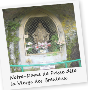
Notre-Dame de Fresse dite la Vierge des Breuleux

Elle a été érigée en 1947 pour fêter le retour des prisonniers et déportés de la Seconde Guerre Mondiale.