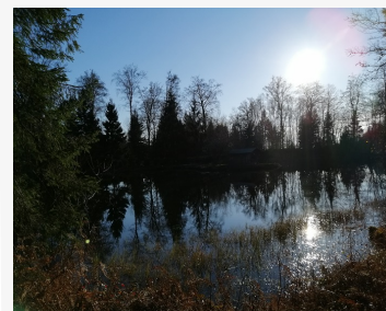
Les Noirs Étangs