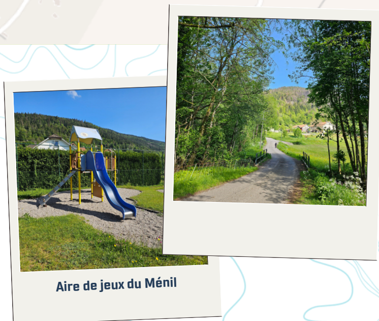
Aire de jeux du Ménil