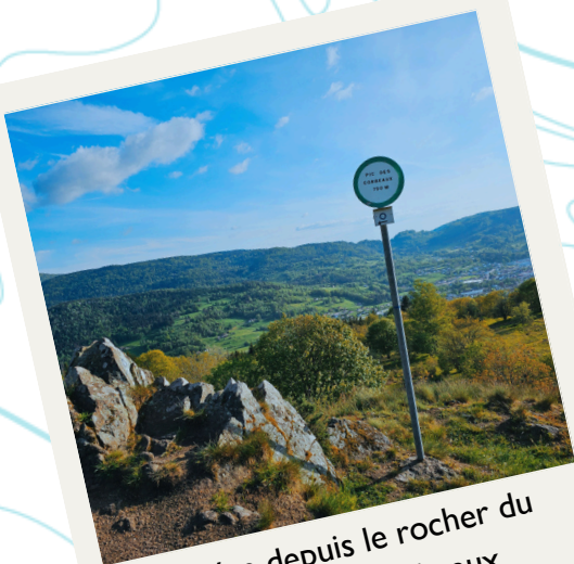
Vue depuis le rocher du Pic des Corbeaux