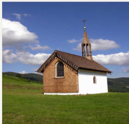
La Chapelle des Vés

“La Chapelle des Vés est idéalement située dans un col au milieu des pâturages et offre une vue saisissante à 360 ° sur les sommets alentours avec en toile de fond les Ballons d’Alsace et de Servance ainsi que la vallée de la Colline.”