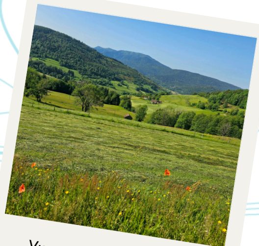
Vue sur les coteaux de Fresse-sur-Moselle