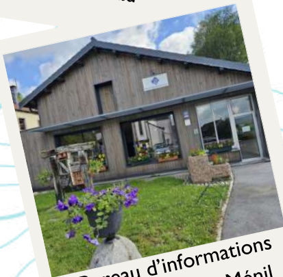
Bureau d'informations touristiques au Ménil