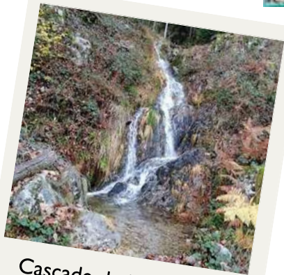
Cascade du Heuchau