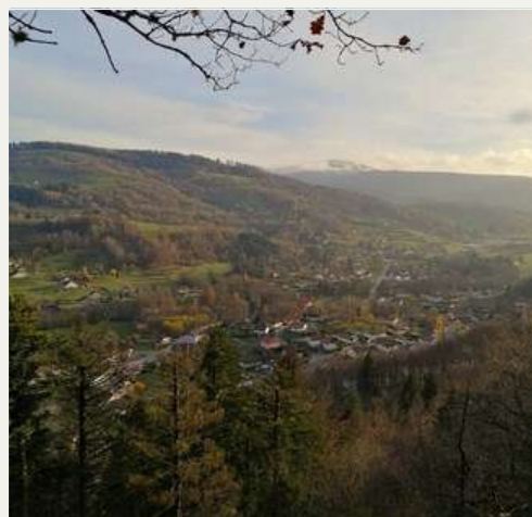
Vue sur le village du Ménil

“ La Grande Roche et la Cascade du Heuchau permettent de savourer toute la diversité des paysages vosgiens sur une courte distance. Une balade pour les amoureux de nature préservée qui veulent prendre un bon bol d'air.”