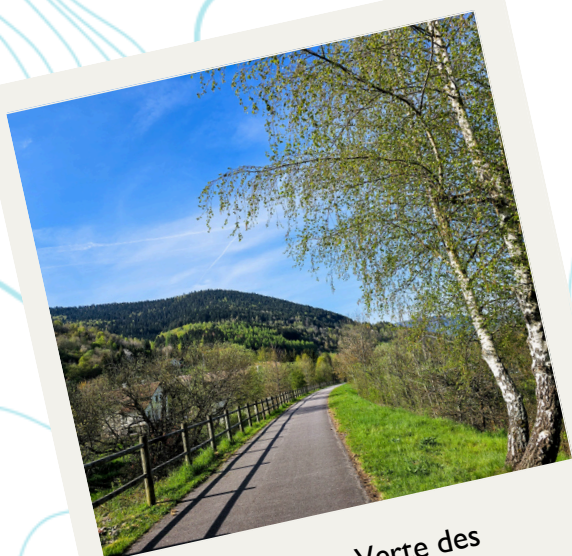
La Voie Verte des Hautes-Vosges