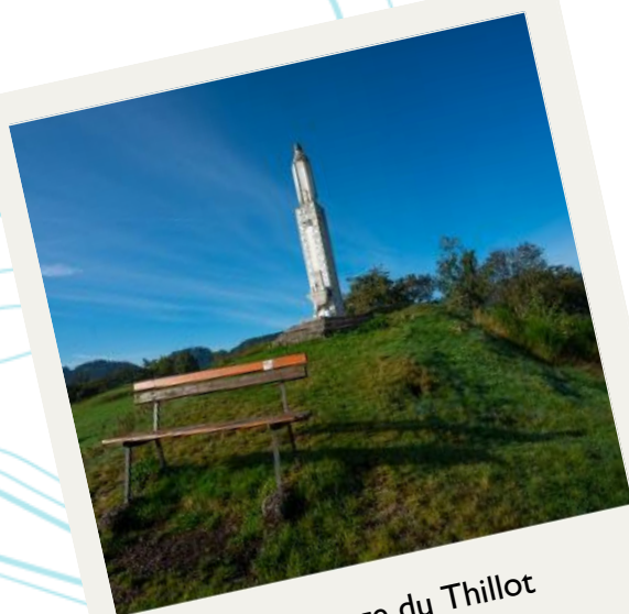
La Vierge du Thillot